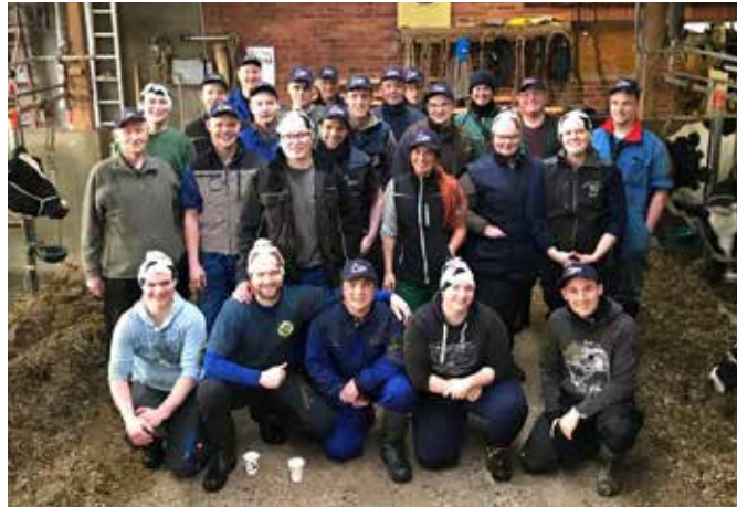
Die Teilnehmer des Eigenbestandbesamer-Kurses im Januar 2020

Auf crv4all.de/anmeldung können Sie sich im Internet verbindlich für einen Lehrgang anmelden.