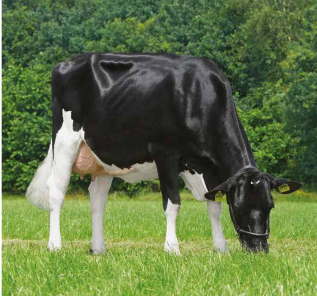
Grantsky ist eine Tochter von Skyfall. Dieser G-Force-Sohn ist neben Danno und Rocky einer der drei neuen töchtergeprüften Bullen im Vererberangebot von CRV.

Der Whatsapp RF-Sohn Magister ist der gegenwärtig am stärksten nachgefragte CRV-Vererber. Ein kleiner Wehmuts tropfen: Er kann die enorme Nachfrage nicht befriedigen.